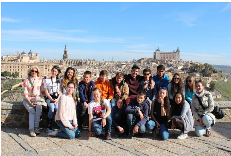
Toledo, la ciudad de las tres culturas.