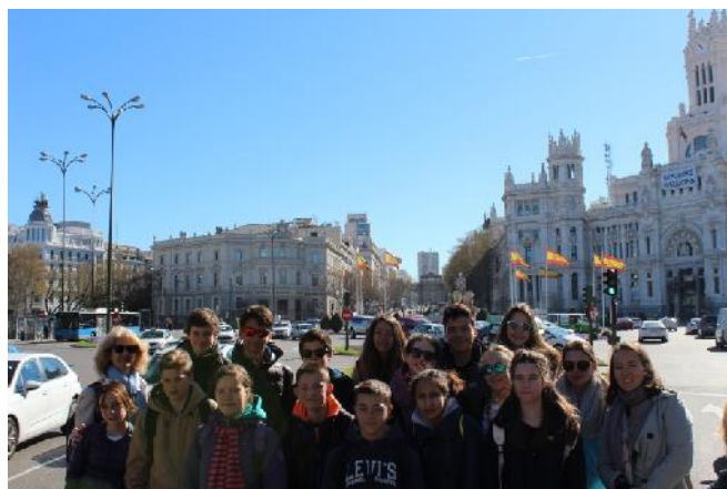
En Madrid, plaza de La Cibeles