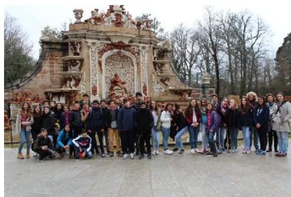
Los jardines del Palacio de la Granja, Segovia