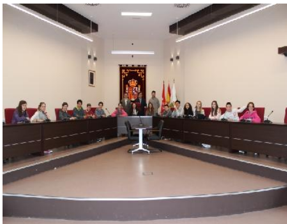
Recibimiento en el Ayuntamiento de Galapagar