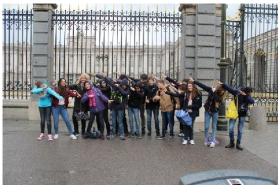
Madrid, Palacio Real